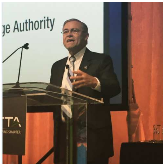
Il Presidente dell'IBTTA Buddy Croft

Il Presidente Buddy Croft , in apertura dei lavori, ha illustrato ai delegati le varie iniziative intraprese dall'IBTTA nel corso del 2016 sotto l'egida del suo tema portante, tra cui l'avvio dei test di conformità per l'applicazione dell'interoperabilità del telepedaggio in Nord America, la pubblicazione di una raccolta di dati sull'utilizzazione della tecnologia nel settore del trasporto stradale, la creazione di un Comitato ad hoc sulla Membership e sullo sviluppo internazionale dell'IBTTA. Nell'ambito della partnership , Buddy Croft ha inoltre annunciato l'organizzazione, nel mese di novembre 2016, di un Summit che riunirà a Washington DC diciassette associazioni attive nel settore dei trasporti e della mobilità, non solo dunque del trasporto stradale. A tal riguardo il Presidente Croft ha sottolineato “ L'industria dei trasporti è in grado di condurre il dibattito sulla mobilità del futuro, a far fronte alle nuove sfide che la tecnologia ci propone e così rendere la vita dei nostri clienti e utenti più facile e più conveniente ”.